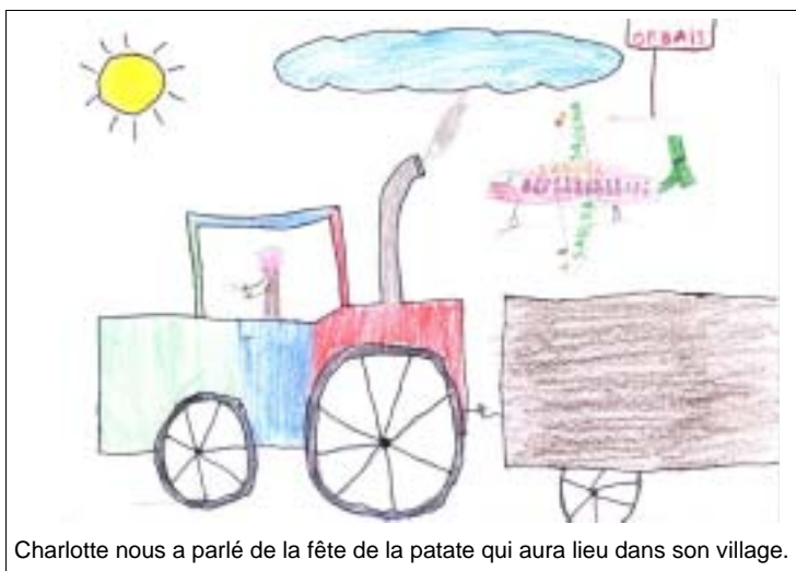
Charlotte nous a parlé de la fête de la patate qui aura lieu dans son village.

Pour illustrer quelques pistes de réponse, nous avons choisi la forme de l'interview.