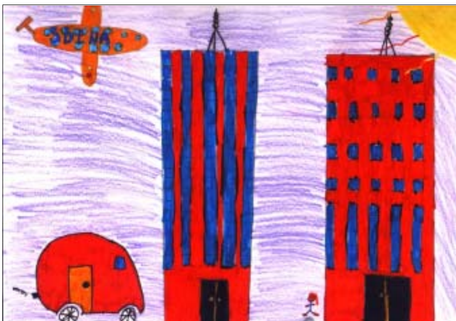
On parle de l'attentat et de ses conséquences

Ce fut le point de départ d'un projet au sein de la classe qui nous amena dans une recherche collective à nous poser de nombreuses questions à propos des guêpes, à échanger des courriers électroniques avec des enfants d'autres écoles, à des activités de graphisme, ... 8